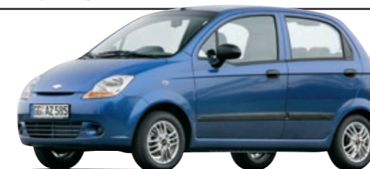
CHEVROLET MATIZ (Typ KLYA/KLAK)

Klein, billig, schlecht – als Schlusslicht in der HU-Statistik nützt auch ein geringer Gebrauchtpreis nichts.