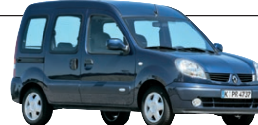
RENAULT KANGOO (Typ K)

So praktisch der Kangoo ist, eine Empfehlung kann er als Mängelriese nicht sein, dafür ist er beim TÜV zu schlecht.