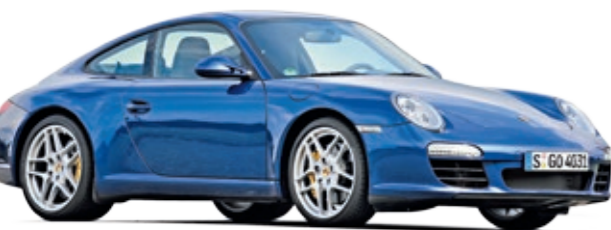
PORSCHE 911 (Typ 997)

Nein, wir haben nicht die Ergebnisse des letzten TÜV-Reports gedruckt: Auch in diesem Jahr ist der Porsche 911 ein Siegertyp, beweist Qualität.