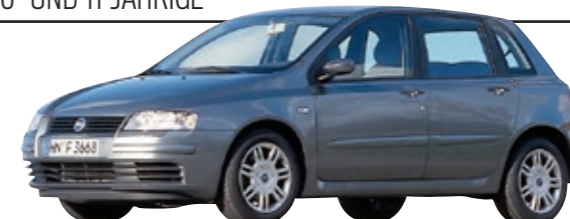
FIAT STILO (Typ 192)

44 Prozent fallen mit erheblichen Mängeln durch, das heißt fast die Hälfte aller vorgeführten Stilo.