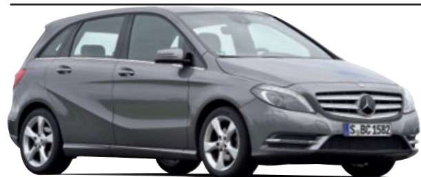
MERCEDES B-KLASSE (Typ W 246)

Die zweite Generation der B-Klasse lässt den Stern über Stuttgart hell funkeln. Der Wagen hat beim TÜV einen glänzenden Auftritt.